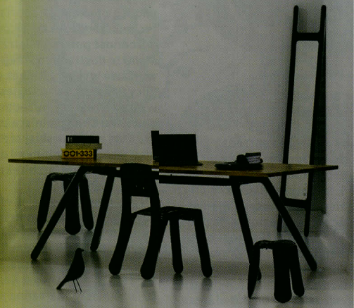
0—19 Chippensteel, fot

...na pozostaje wciąż ...komunikacji, w sku- ...krytyki, w siłę prawdy ...Presji. Oraz w prze- ...Przestrzeń, w której ...niskrepowana ko- ...system komunikacji ...Publicznej głównie ...zwywiście rządzi się ...Czy nie jest to rodzaj ...dal wierzymy? Insta- ...rber ma wydobyć na ...oblicze przestrzeni ...ścisłość do neutralizowa- ...żu przez dodanie go- ...stych i tworzących ...komunikatów. Przekaz ...ocześnie zagluszony ...że w urywkach, na- ...ja się echem dyskurs ...o wszystkich i do ...Aleksandra Hirszfelfa, ...Informacji, interak- ...kowej umieszczonej ...nej. ...Został na zlecenie All ...damu w ramach pro- ...Arch Initiative. Praca ...riny Abramović, Johna ...Joao Simones, Jona ...nga, Pors&Rao, Rantijt ...Hirschhorna stanowi ...onych twórczości ...prezentowana jest na ...reloaded.